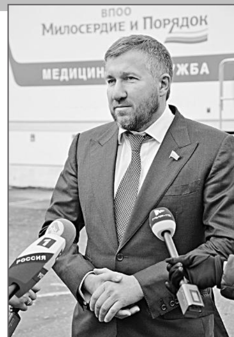
Депутат Госдумы Григорий Аникеев:

В ближайшее время врач-маммолог будет принимать в Александровском, Петушинском, Судогодском, Собинском районах. Ознакомиться с графиком работы «Передвижных центров здоровья» можно в группах в социальных сетях и на официальном сайте общественной организации «Милосердие и порядок».