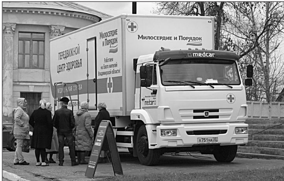
С ноября 2015 года бесплатно обследовано более 54 000 человек.